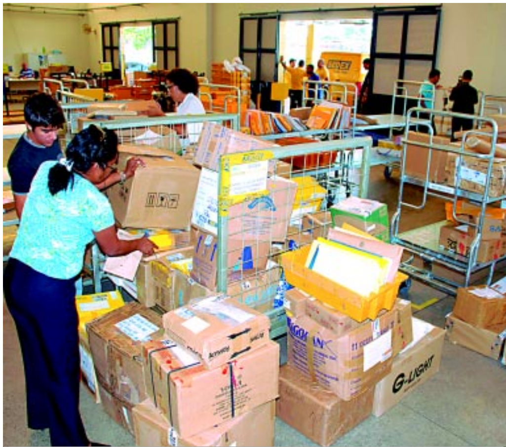
Cerca de 3,2 toneladas de correspondências deixaram de ser entregues pelos carteiros por dia na PB