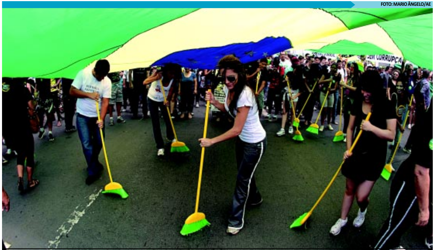
Manifestantes exigiram o fim do voto secreto no Congresso, a adoção da Lei Ficha Limpa em 2012 e a inclusão da corrupção como crime hediondo

O presidente da Corte, Ricardo Lewandowski, disse que em suas visitas pelo interior do país tem percebido o apreensão de cidadãos com o aumento do número de vereadores. “A população está inquieta e muitas vezes contrária a esse aumento. Mas o Artigo 29 Inciso 4 [que contém a regra] é explícito e não cabe ao TSE ingressar em detalhes maiores”.