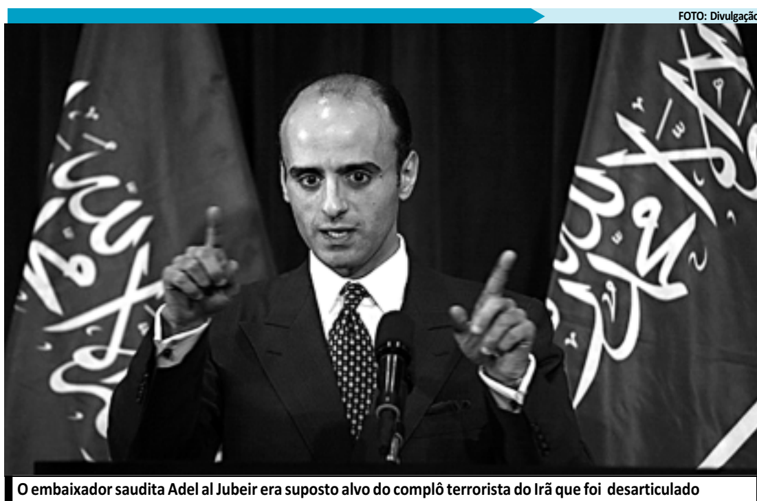
O embaixador saudita Adel al Jubeir era suposto alvo do complô terrorista do Irã que foi desarticulado

REAÇÃO - A secretária de Estado americana, Hillary Clinton, disse ontem que os EUA se preparavam para adotar novas sanções contra o Irã após a descoberta do plano terrorista de Teerã. Segundo ela, o plano que foi desbaratado deve "isolar ainda mais" o Irã da comunidade internacional.