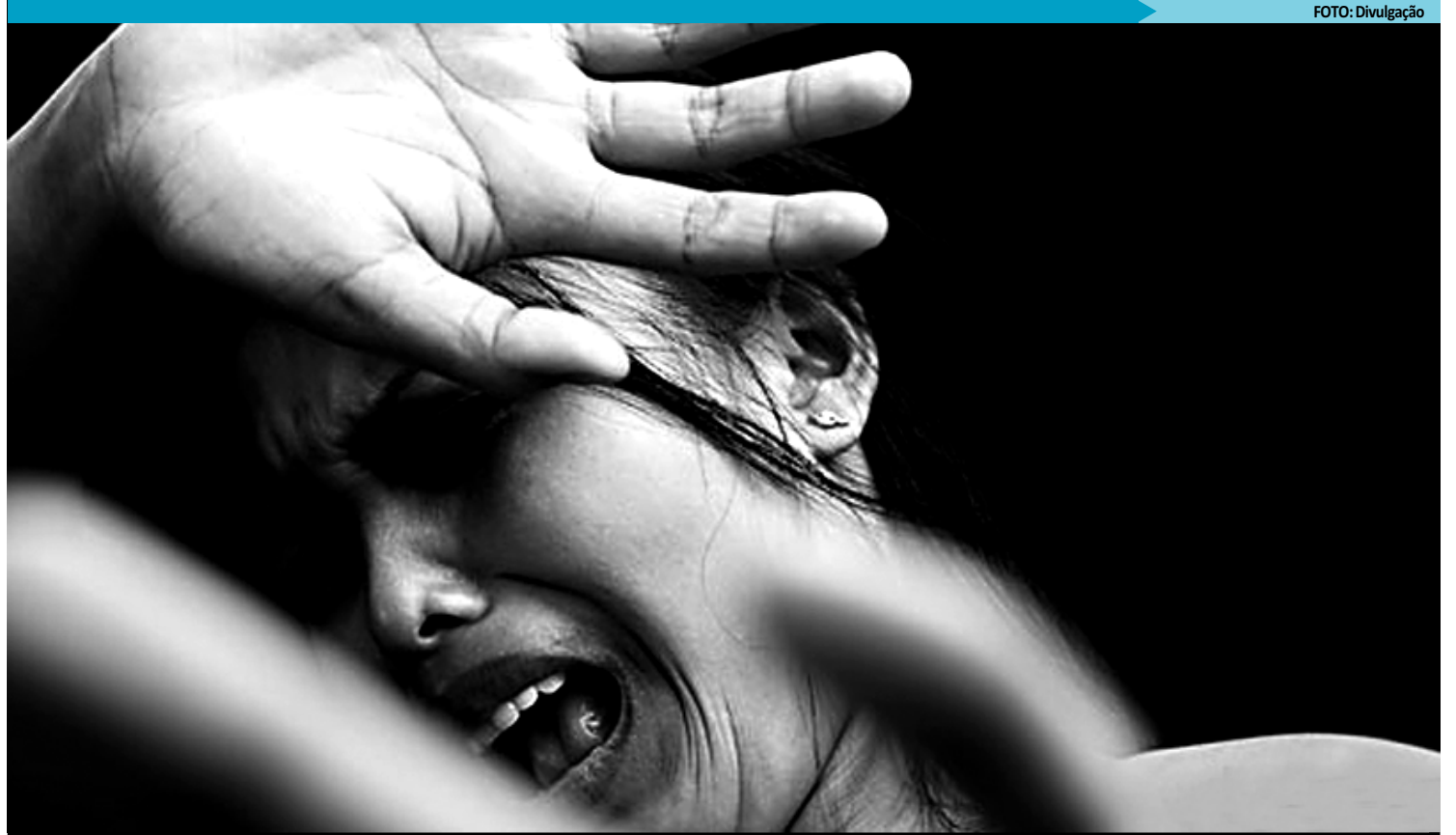
A Casa Abrigo vai atender vítimas de violência em todo o Estado e tem capacidade para abrigar 20 mulheres e 10 crianças simultaneamente

"Além das definições estruturais, que garantem, inclusive, espaço adequado para que os filhos menores das vítimas abrigadas realizem atividades, a localização da casa precisa ser mantida em sigilo, para evitar a aproxima-