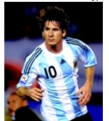
Messi voltou a ser questionado