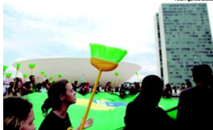
Manifestantes com vassouras participam da Marcha em Brasília

As praias e o Parque Zoobotânico Arruda Câmara, mais conhecido por Bica, ficam lotados durante o feriado de ontem. Mais de 20 mil pessoas visitaram a Bica e puderam olhar os animais e também receber atendimento médico e participar de palestras de conscientização ecológica e brincadeiras. Já pelas praias de Cabo Branco e Tambaú devem ter passado 30 mil pessoas, segundo estimativas do Corpo de Bombeiros. PÁGINA 9