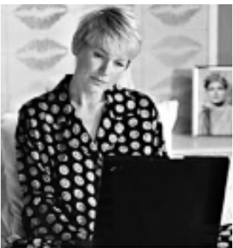
A Globo exibe Xuxa Popstar