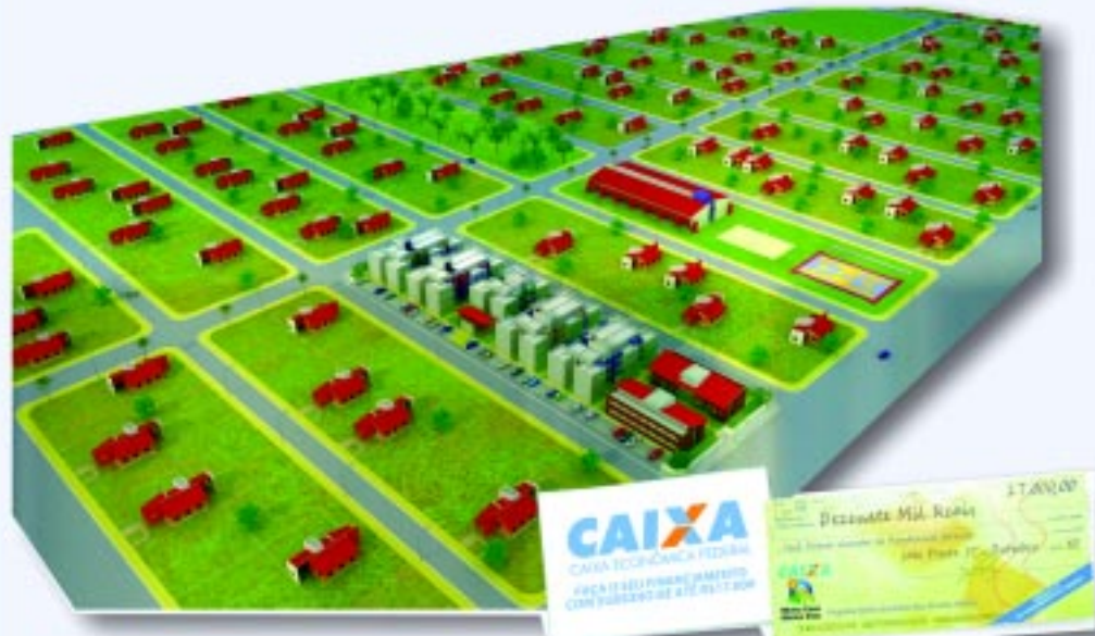
Perspectiva ilustrativa do bloco 01