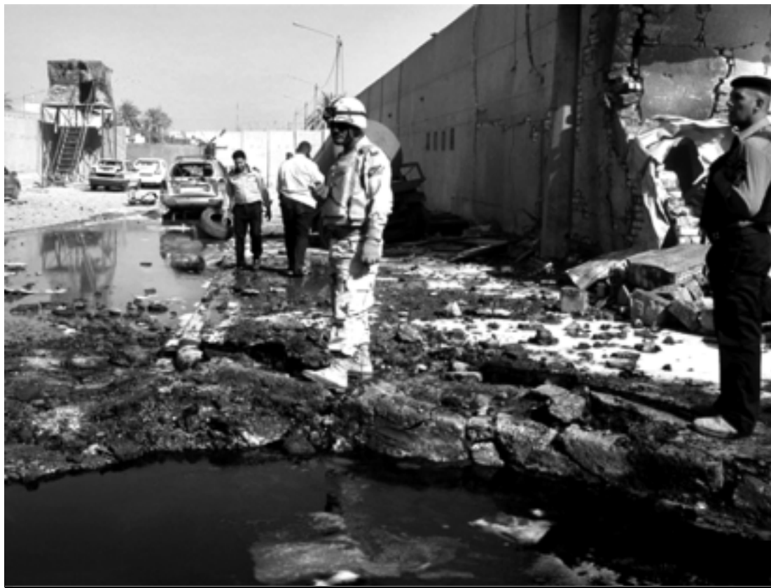
Soldado observa local de ataque a bomba, na capital iraquiana, onde aconteceu uma série de atentados

Shalit foi capturado em 25 de junho de 2006, com 19 anos, enquanto cumpria o serviço militar obrigatório e fazia uma ronda na fronteira com a Faixa de Gaza.