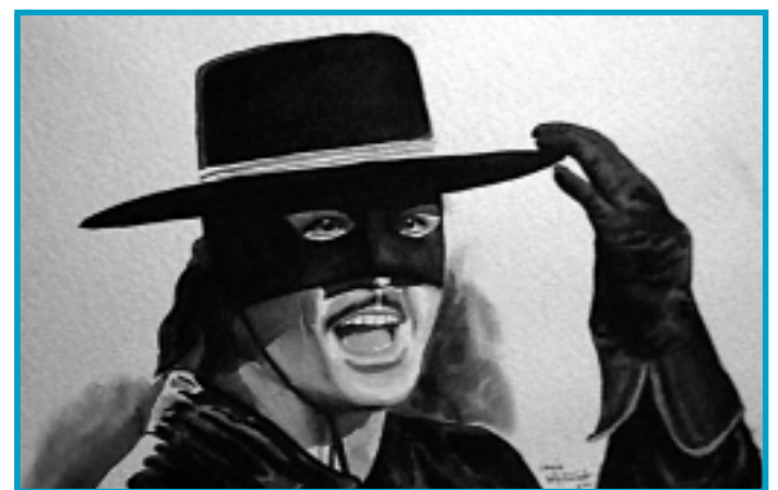
ZORRO DE VOLTA AO CINEMA

# A cantora Beyoncé está sendo acusada de plagiar um vídeo de uma coreógrafa belga no clipe da música 'Countdown', lançado na semana passada. Anne Teresa De Keersmaeker afirmou, em entrevista à Aceshowbiz , não "ser louca" e que o clipe de Beyoncé é "plágio" de seu trabalho. "Isso é roubo. Eles pegaram pedaços de 'Achterland' e 'Rosas danst Rosas'. É um pouco rude, devo dizer". A coreógrafa disse ainda, na entrevista, que Beyoncé pensou que poderia se safar por ser famosa. "O que é rude nisso tudo é que eles nem tiveram o trabalho de disfarçar". 'Countdown' faz parte de 4, álbum mais recente de Beyoncé.