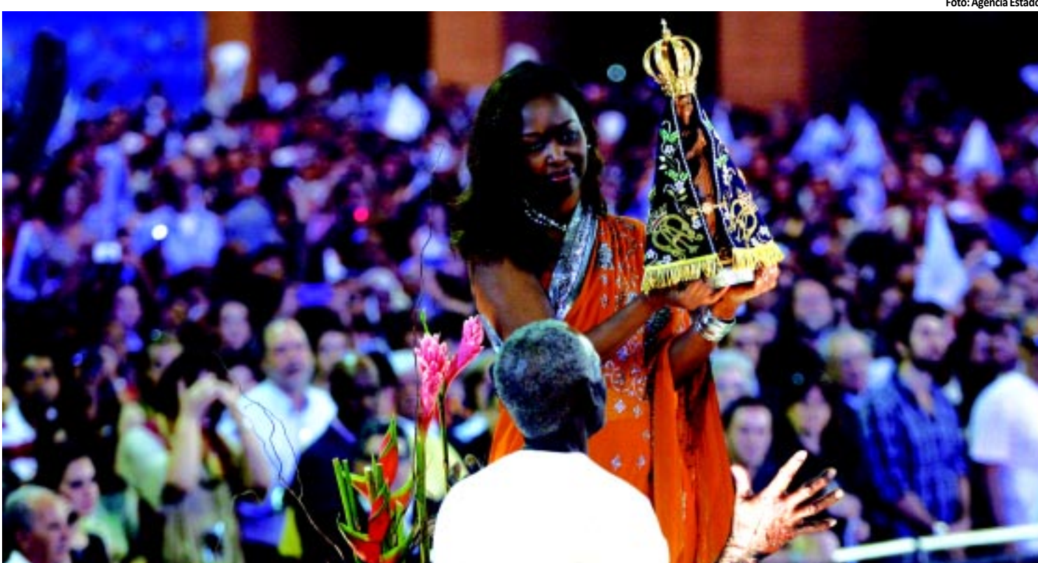
RELIGIÃO | Imagem de Nossa Senhora chega à missa no Santuário Nacional de Aparecida do Norte PÁGINA 6

gicas. Em todo o país são 989 municípios correndo o risco de passarem por esta nova epidemia. Ao todo está previsto um incremento de R$ 90 milhões. PÁGINA 8