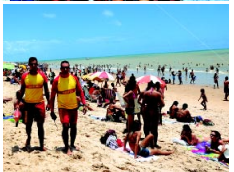
A fila para entrar na Bica começou logo cedo, lá dentro as crianças se divertiram com jogos e brincadeiras; na praia, os bombeiros ficaram atentos