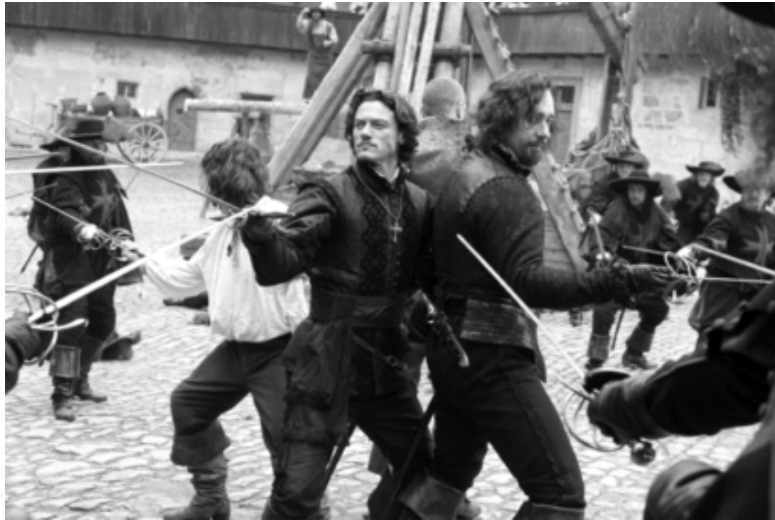
Os novos mosqueteiros têm ares de estrelas de rock da época. Se o público gostar, terá sequência, segundo Anderson

Já diz a máxima que quando se trata de adaptar um livro para o cinema é melhor "esquecer" o original para melhor transportar a história para a telona. Quando se trata de renovar um clássico como Os Três Mosqueteiros , de Alexandre Dumas, que já ganhou incontáveis versões para o cinema, o diretor Paul W. S. Anderson (de Resident Evil ) faz questão de deixar de lado alguns detalhes do original de 1844 e adicionar alguns outros novos. O filme foi totalmente rodado em tecnologia 3D; os cenários da lendária corte francesa do século XVII e da Torre de Londres são, na verdade, tesouros históricos da Bavária, na Alemanha; o elenco não é e nem fala francês. Os Mosqueteiros têm ares de estrelas de rock da época; D'Artagnan é americano (Logan Lerman), o cardeal Richelieu é vivido pelo alemão Christopher Waltz e Milady de Winter, vivida pela russa Mila Jovovich (mulher de Anderson), tem ares de Bond Girl. Sua personagem, aliás, não só é mestre da dissimulação como agente dupla capaz de fazer manobras dignas da heroína que a atriz vive em Resident Evil vestindo pesados vestidos barrocos.