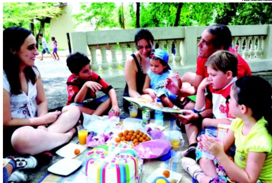
O Parque Zoobotânico Arruda Câmara atraiu famílias inteiras que aproveitaram o espaço para fazer piquenique

As praias e o Parque Zoobotânico Arruda Câmara, mais conhecido por Bica, ficam lotados durante o feriado de ontem. Mais de 20 mil pessoas visitaram a Bica e puderam olhar os animais e também receber atendimento médico e participar de palestras de conscientização ecológica e brincadeiras. Já pelas praias de Cabo Branco e Tambaú devem ter passado 30 mil pessoas, segundo estimativas do Corpo de Bombeiros. PÁGINA 9