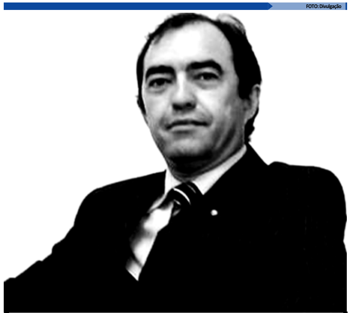
O procurador Roberto Moreira alerta os partidos políticos quanto aos prazos e conduta antes das eleições

O diretório municipal do PSB de Cabedelo também já lançou seu pré-candidato à prefeitura da cidade para as eleições do ano que vem. O nome do vereador Wellington Brito foi lançado pelo presidente da executiva municipal, José Carlos Biazon, que afirmou que o partido do governador Ricardo Coutinho vai unir forças para eleger o maior número de vereadores nas eleições de 2012.