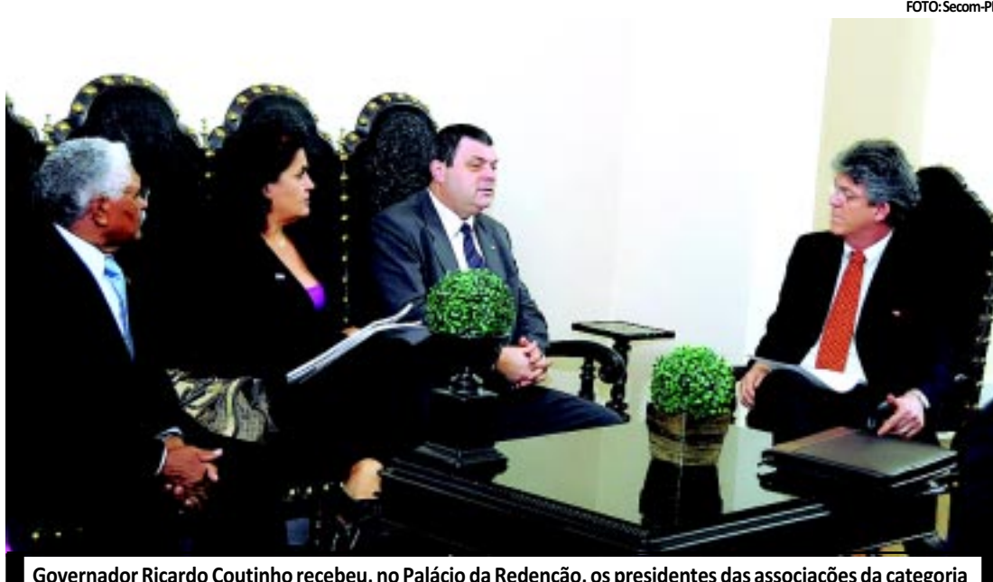
Governador Ricardo Coutinho recebeu, no Palácio da Redenção, os presidentes das associações da categoria

Na reunião da CCJ de segunda-feira, o vereador Bruno Farias (PPS) sugeriu que os projetos julgados na ocasião fossem imediatamente levados à plenária hoje, já que ontem (dia em que tradicionalmente ocorrem as votações na Casa) foi feriado. Isso para dar celeridade às tramitações. Com essa indefinição, somente na próxima segunda-feira é que o Colegiado de Líderes vai decidir quais matérias serão votadas no plenário.